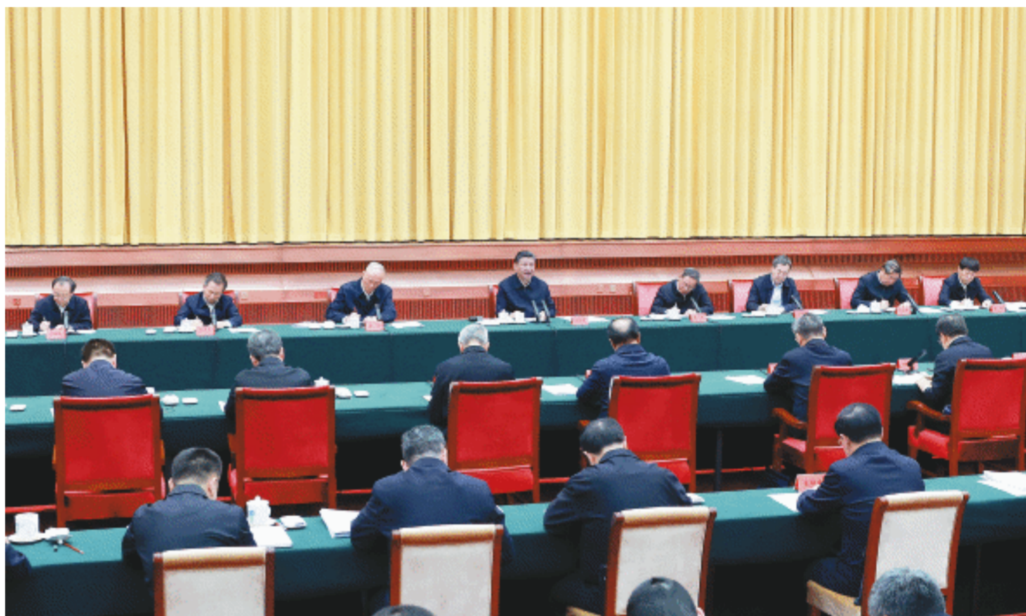
3月20日下午，中共中央总书记、国家主席、中央军委主席习近平在湖南省长沙市主持召开新时代推动中部地区崛起座谈会并发表重要讲话。

新华社长沙3月20日电 中共中央总书记、国家主席、中央军委主席习近平20日下午在湖南省长沙市主持召开新时代推动中部地区崛起座谈会并发表重要讲话。他强调，中部地区是我国重要粮食生产基地、能源原材料基地、现代装备制造及高技术产业基地和综合交通运输枢纽，在全国具有举足轻重的地位。要一以贯之抓好党中央推动中部地区崛起一系列政策举措的贯彻落实，形成推动高质量发展的合力，在中国式现代化建设中奋力谱写中部地区崛起新篇章。