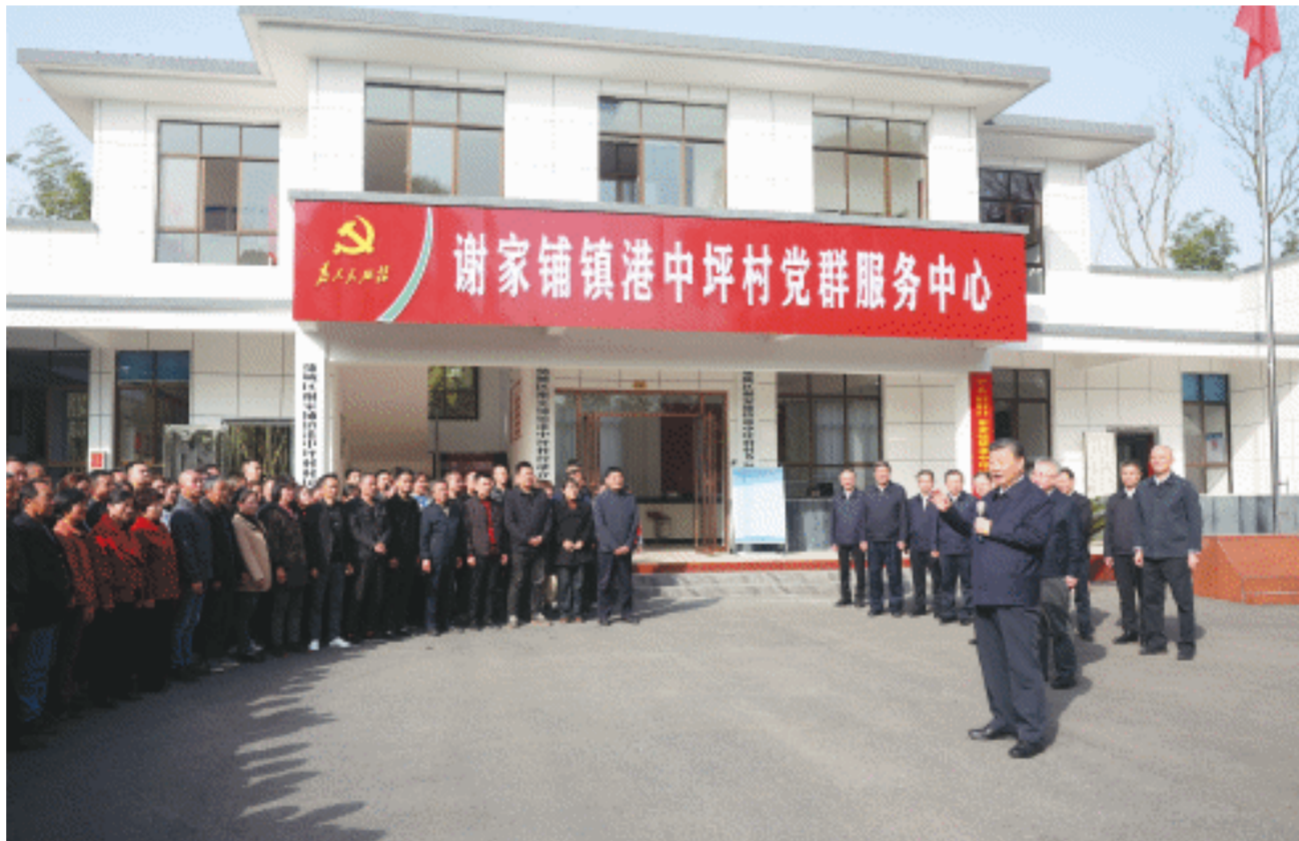
3月18日至21日，中共中央总书记、国家主席、中央军委主席习近平在湖南考察。这是19日下午，习近平在常德市鼎城区谢家铺镇港中坪村考察时，同乡亲们亲切交流。