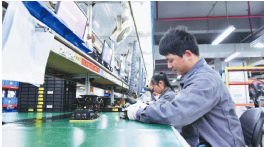
唐智科技专为航空发动机、轨道交通等领域提供健康管理和智慧运维技术、产品和服务，主要产品的市场占有率在同行业中处于优势地位。