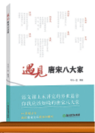
《遇见唐宋八大家》/司马一民 编著/浙江教育出版社/2024年2月