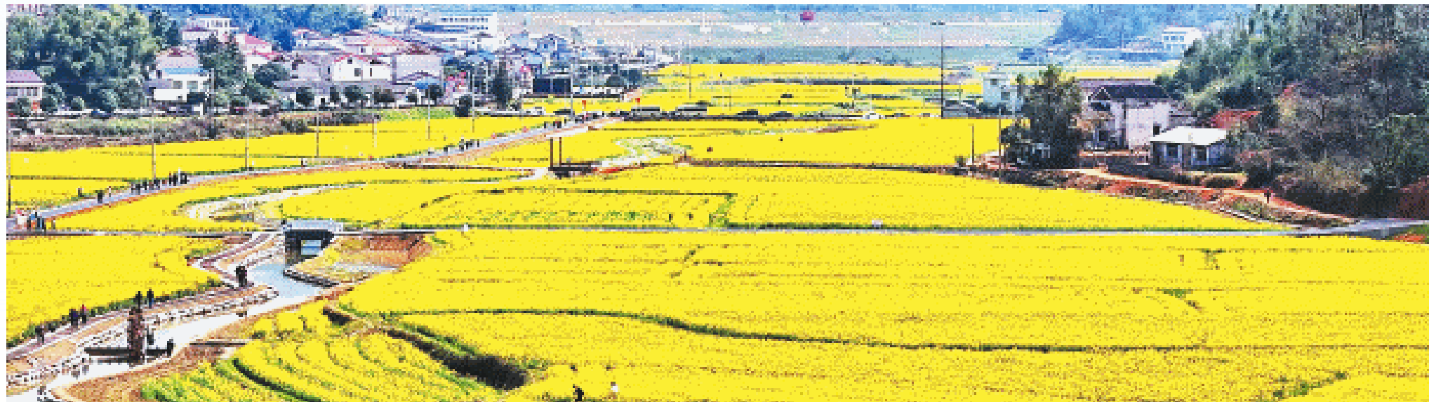
九峰如黛、绿水成碧、塔树生辉，万亩油菜花海怒放，醉人美景引来数十万游客流连忘返。

习近平总书记指出，推进乡村全面振兴是新时代新征程“三农”工作的总抓手。作为湖南省抓党建促乡村振兴示范镇，茶亭镇将继续以花为媒，推进农文旅体融合发展，持续擦亮“五彩茶亭 芳香茶亭”农旅融合品牌，推动特色产业发展、人居环境改善、集体经济壮大、农民增收致富、和美乡村建设等“多头并进”，把乡村振兴的美好蓝图变为现实。