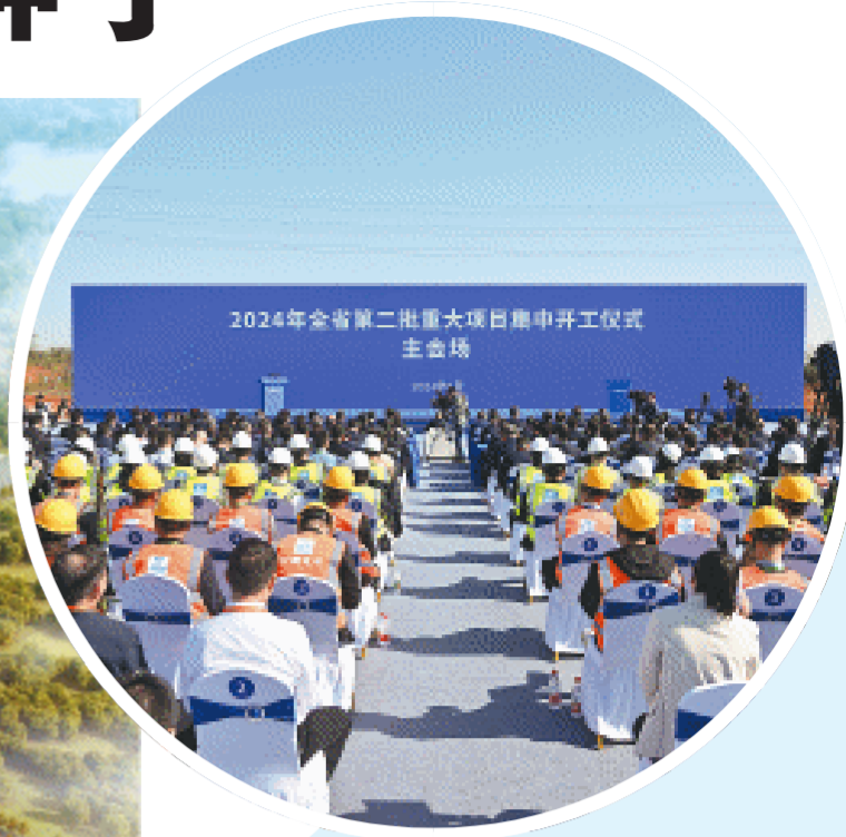
↑29日，2024年全省第二批重大项目集中开工仪式在位于宁乡经开区的海信长沙综合生产基地项目举行。