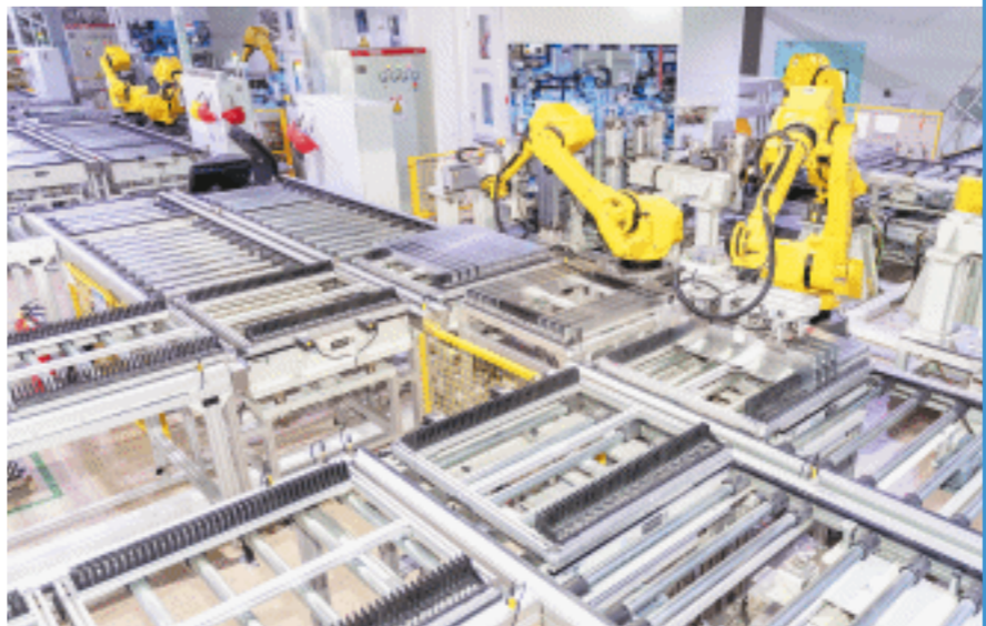
长沙弗迪电池有限公司内,机器人有条不紊进行刀片电池封装。