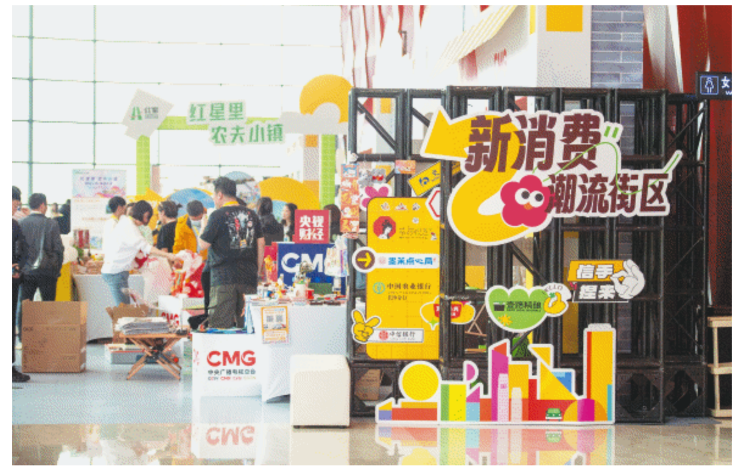
3月30日,峰会现场,夜经济示范区和新消费示范区里,长沙夜经济和新消费品牌集中亮相,长沙元素满满。

彭健明表示,作为中国夜间经济活力的“风向标”城市,长沙已连续三年荣登“中国城市夜经济影响力十强城市”。夜间经济是促进消费、稳定就业的重要载体,也是孕育时尚新品、锻造国货“潮品”的竞技场和试验田,更是现代城市经济的重要组成部分。今年,总台财经节目中心发布首份央视财经“中国夜经济活力指数报告”和《金牌新字号》金牌推荐榜入围