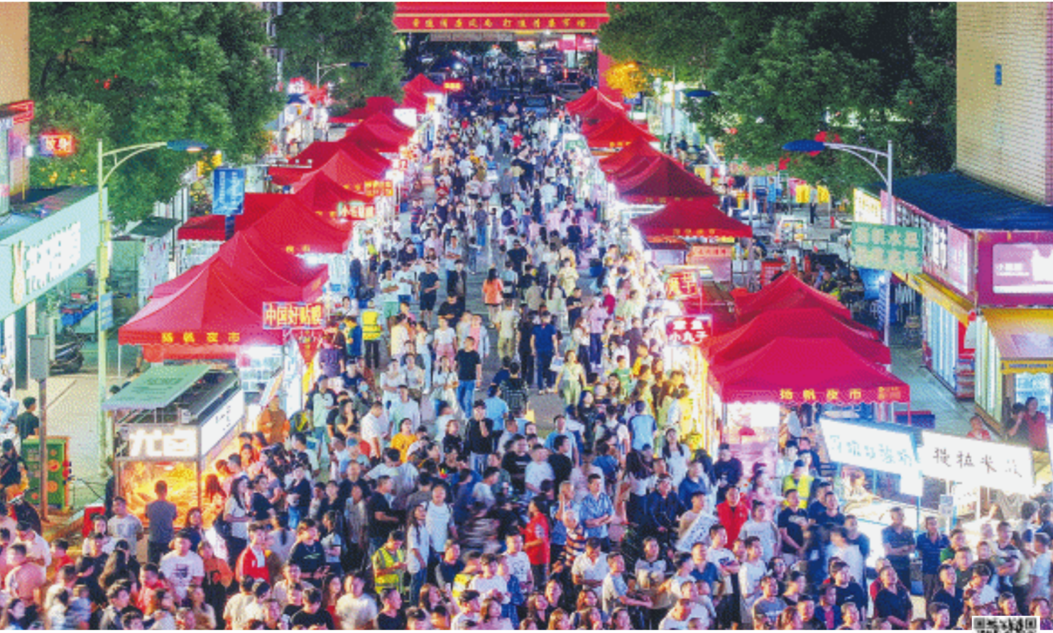
夜晚的扬帆夜市人头攒动，热闹非凡。扬帆夜市此次获评“2023年长沙市夜间消费示范街区”。