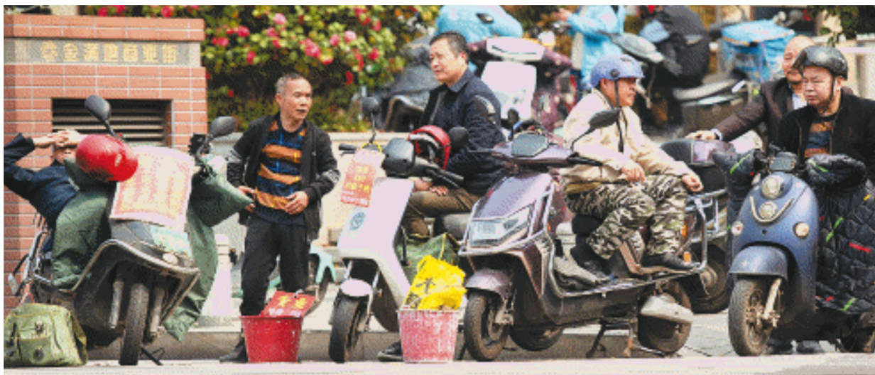
↑3月27日，开福区中山亭附近，一群骑着电动车的工友聚在路边一起等活。