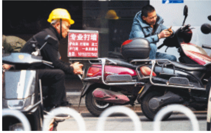
等工的电动车上会显眼地写着零工手艺和电话。

早在2021年，国家统计局数据显示，我国灵活就业人员约有2亿人，灵活就业日益成为一种重要就业形式。在灵活就业人员之中，年龄偏大、技能相对单一的“马路零工”群体，不论是工作环境还是“等活”方式，更显零落。 人社部等五部门于2022年联合发布《关于加强零工市场建设完善求职招聘服务的意见》。近年来，除原有的长沙市人力资源市场等公共服务场所，长沙还陆续建设了多个零工市场。然而，记者走访发现，虽然这些场所建设得很好，却很少有上述“马路零工”人员前去寻找工作。 1月18日下午，当东二环远大路立交桥下有30多名“马路零工”在路边等活时，距此仅3公里的美蓉区零工市场，不论门口还是室内，没有一位求职者。 旁边一位社区工作人员介绍，该零工市场主要是通过线上途径进行求职对接，平时到该零工市场线下求职的人确实不多，从事装修、建筑方面的零工来此求职的更少。 “我们社区也开展一些就业服务工作，但给‘马路零工’介绍工作的机会很少。”该社区工作人员称，一方面，“马路零工”的用工需求临时性强，社区难以及时掌握信息；另一方面，社区无法核查“马路零工”的资质，作为中间一环，也不便于向居民推荐。 长沙市人力资源市场距离中山路“马路市场”虽只有两公里，但记者于1月19日上午在长沙市人力资源市场大厅及门口