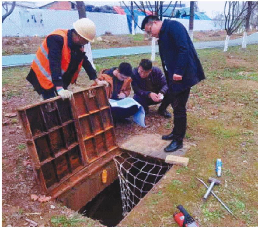
图为重点项目工程建设审计现场。