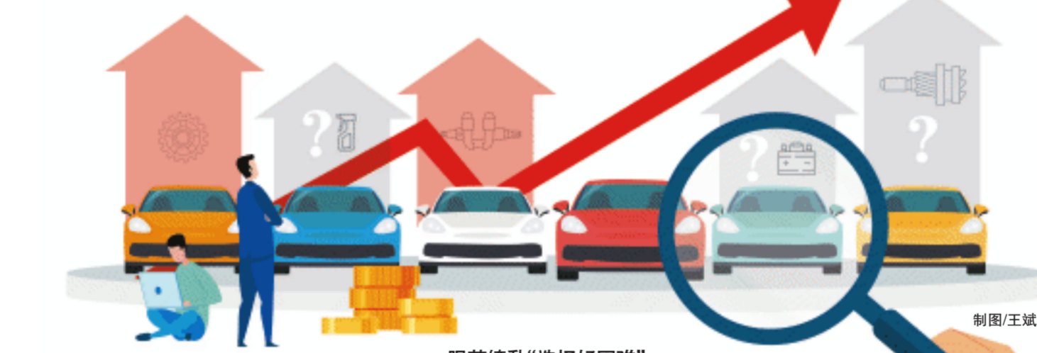
眼花缭乱的“选择好困难”

此前还有不少上市企业在互动平台上有所“表示”。扬杰科技表示“已进入小米汽车首批优选供应商名单,并且已经有部分产品批量交货”,江波龙表示“向小米汽车供应了公司旗下Foresee品牌的车载DVR高速闪存盘”,商络电子表示“通过Tier1供应商间接为小米汽车供应阻容感、二三极管、电源芯片等电子元器件”,并明确表示“公司将间接受益于小米汽车上市”。