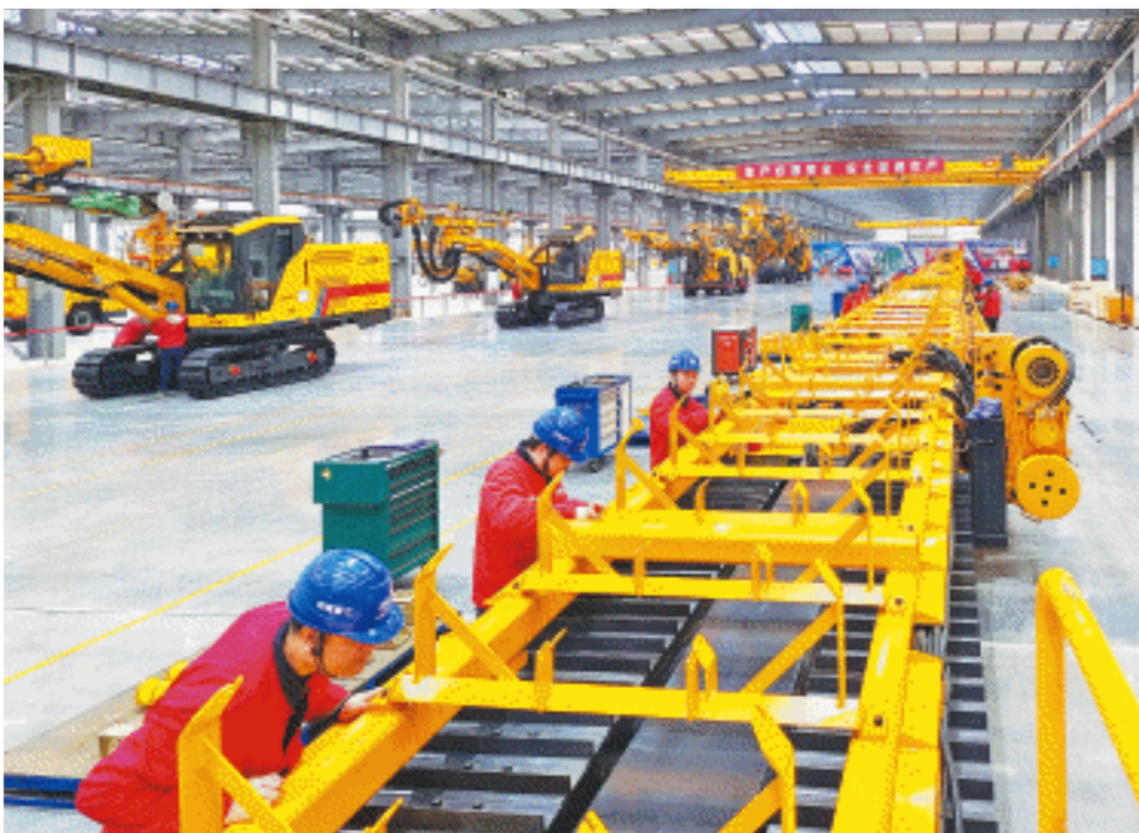
位于长沙经开区的铁建重工长沙第三产业园区(一期)是一季度90个新投产的项目之一。图为园区车间内,工人们正在装配、调试产品。长沙晚报全媒体记者 郭雨滴 摄

要产品为新一代半导体碳化硅功率芯片、碳化硅超级充电桩;宁乡高新区的阿斯米新材料年产2万吨锂离子电池石墨负极材料项目,将建设锂离子电池石墨负极材料生产及相关设备制造基地;再看“不厌旧”。与培育新兴产业相对应的,是长沙始终把传统产业抓在手上,依托技术升级、设备更新等,加快转型升级步伐。这也是为何工程机械、汽车、食品、生物医药等传统优势产业项目,占据了新开工和新投产的另外“半壁江山”。