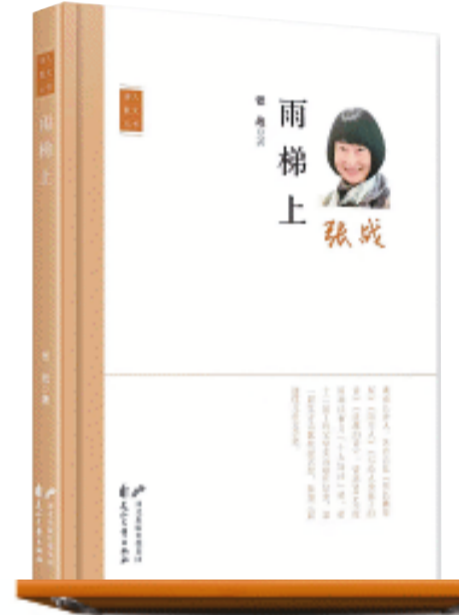
《雨梯上》张战 著/花山文艺出版社/2023年12月

第三辑《雨梯上》颇耐人寻味。张战多篇提到“我有一个女朋友”“我的女朋友”“另一个女友”……我把这些“女友”都看作她自我