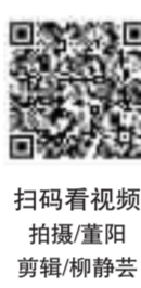
扫码看视频 拍摄/董阳 剪辑/柳静芸