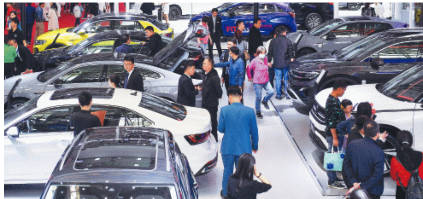
每次车展都吸引了众多市民前来选车购车。 (资料图)