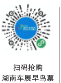
扫码抢购 湖南车展早鸟票