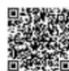
扫码看中国队 取得开门红

主创团队介绍,此次研讨会虽然是《仰望星空》剧本第一次亮相,但已经是第九稿,接下来将充分吸收研讨会意见和建议,进一步打磨提升剧本,年内完成立体创排。