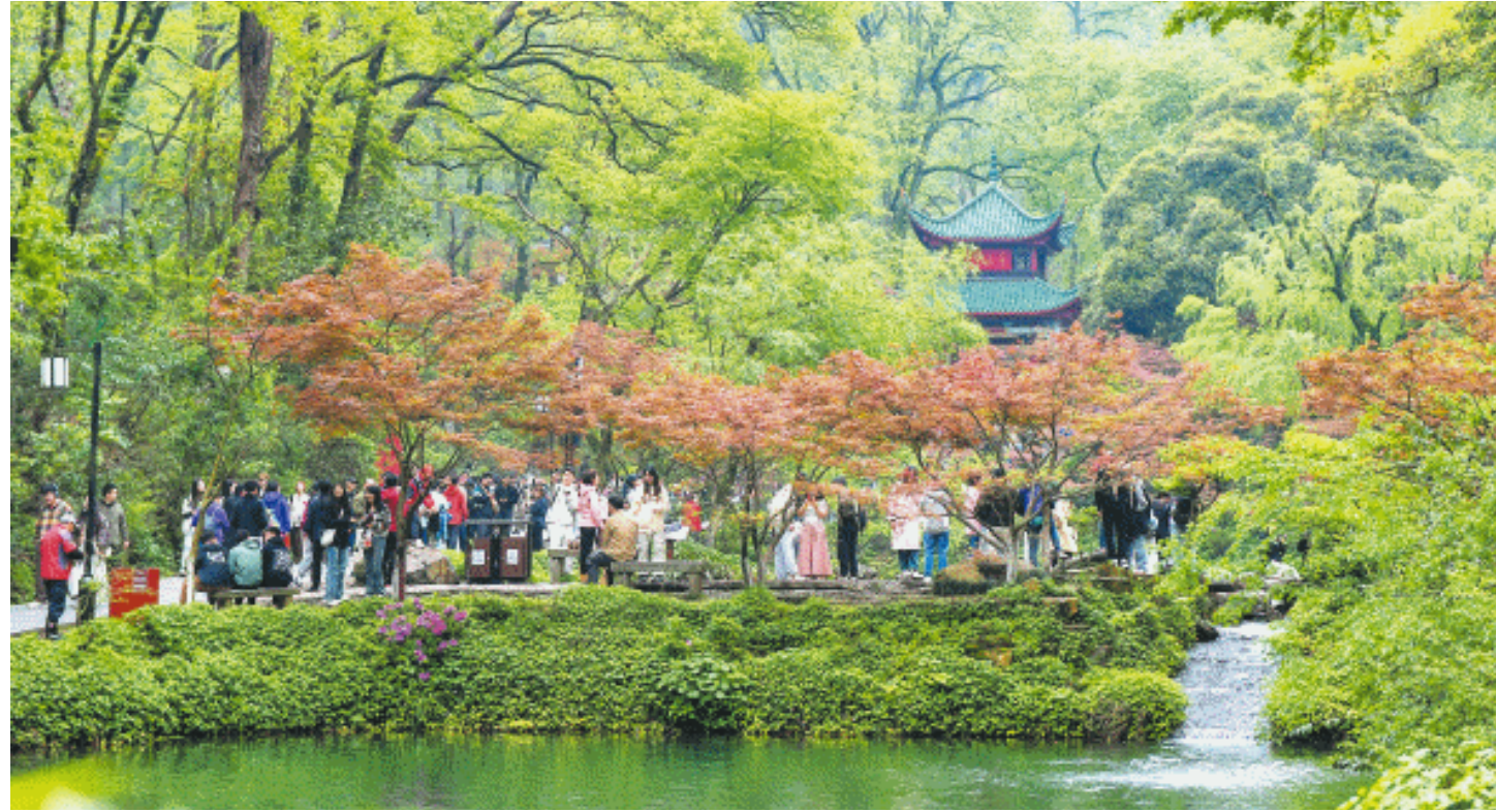
经历雨雪冰冻后,岳麓山迅速复绿,如今正焕发勃勃生机。

区、武警长沙支队、湘江集团应急队、雪天盐业、蓝天救援队、红十字会等多方志愿单位一起投入到景区的清障排危工作中。2000多名志愿者与景区800多名工作人员一起全力展开应急抢险,经过3天夜以继日的工作,除夕的下午景区重新开园迎客。