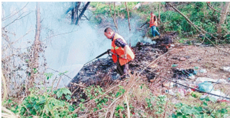
“智慧环卫”紧急就近调度环卫作业车直冲火情现场,环卫工用高压水枪灭火。

长沙晚报4月15日讯(全媒体记者 李卓 通讯员 向薇)在开福“智慧环卫”指挥中心大屏幕上,全区80台大型洒水车和104台养护车位置一目了然,路面突发险情,鼠标轻点,距离最近的环卫车秒变消防救援车,通过车载高清摄像、定位系统等终端设备精准施救。14日,开福区市容环卫维护中心通报,该区“智慧环卫”3.0版全新升级,数字化赋能之下,市容监管从主次干道延伸至背街小巷,同时环卫作业车辆也“兼职”成为移动应急救援平台,灭火、防涝第一时间“救”在路上。