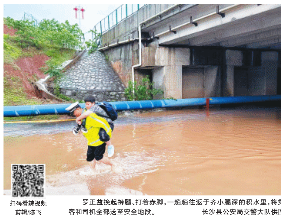
扫码看辣视频 剪辑/陈飞