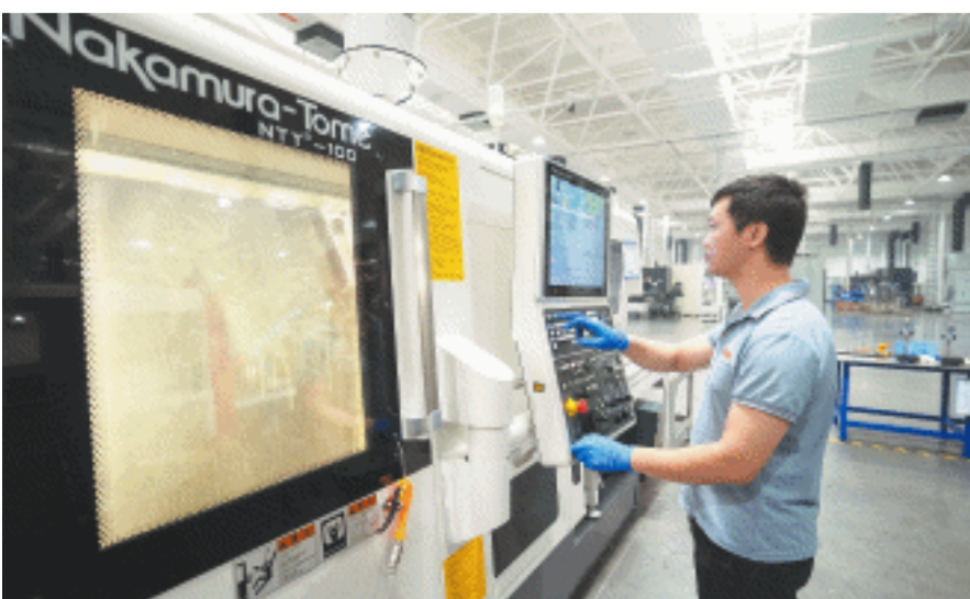
长沙桑特液压项目总投资约3亿元,建筑面积3万多平方米,2023年初全面建成投产。图为桑特液压员工在生产车间工作。

长沙桑特液压九成员工来自外省,大家喜欢上了长沙并开始购房置业,公司也与长沙龙头企业形成半小时供应圈,发展势头更强劲