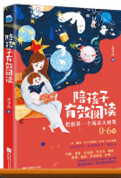
《陪孩子有效阅读》/王子丹 著/2023年7月/江苏凤凰文艺出版社

时下,不少的家长对孩子的教育可谓倾尽了心力,为了让孩子尽可能多学些知识,他们一有空闲就会买来大量的书籍,供孩子阅读。至于孩子是否喜欢这些书籍,读书的效果又如何,做家长的则未必能知一二。为了化解这种矛盾,本书作者提出了解决之道,号召父母要有跟进意识。首先,家长要选那些契合孩子兴趣的好书;其次,要学会陪伴他们一起阅读。而整个过程既需要亲情的投入,也需要家长读书上的引导。即在读书之初,家长要有意识