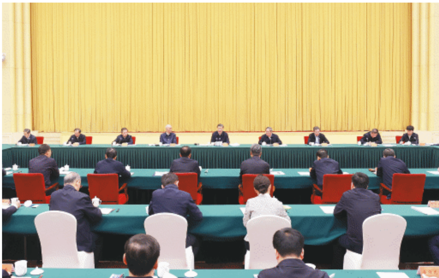
4月23日下午，中共中央总书记、国家主席、中央军委主席习近平在重庆主持召开新时代推动西部大开发座谈会并发表重要讲话。

新华社重庆4月23日电 中共中央总书记、国家主席、中央军委主席习近平23日下午在重庆主持召开新时代推动西部大开发座谈会并发表重要讲话。他强调，西部地区在全国改革发展稳定大局中举足轻重。要以一以贯之抓好党中央推动西部大开发政策举措的贯彻落实，进一步形成大保护、大开放、高质量发展新格局，提升区域整体实力和可持续发展能力，在中国式现代化建设中奋力谱写西部大开发