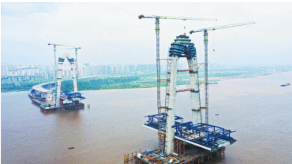
23日，长沙兴联路大通道项目51号主墩索塔塔冠顺利完成浇筑。