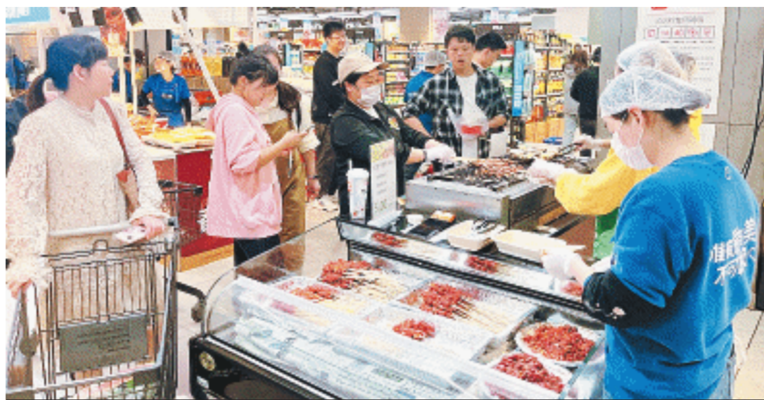
盒马把烧烤摊搬进门店,供消费者现买现烤现吃。

“顾客既可以在门店现烤现吃,又能把烧烤食材及工具搬回家,轻松省去清洗、腌制、穿串等流程,随时随地烧烤。”何小青介绍,尤其针对出游市民,盒马上架了大量适合户外露营、开袋即可开烤的商品,其中澳洲和牛M5+牛肉串、盐池滩羊肉串、三拼烧烤肉串、西北辣子烤肉串等都是最受欢迎的单品,销售环比增长了超10倍。