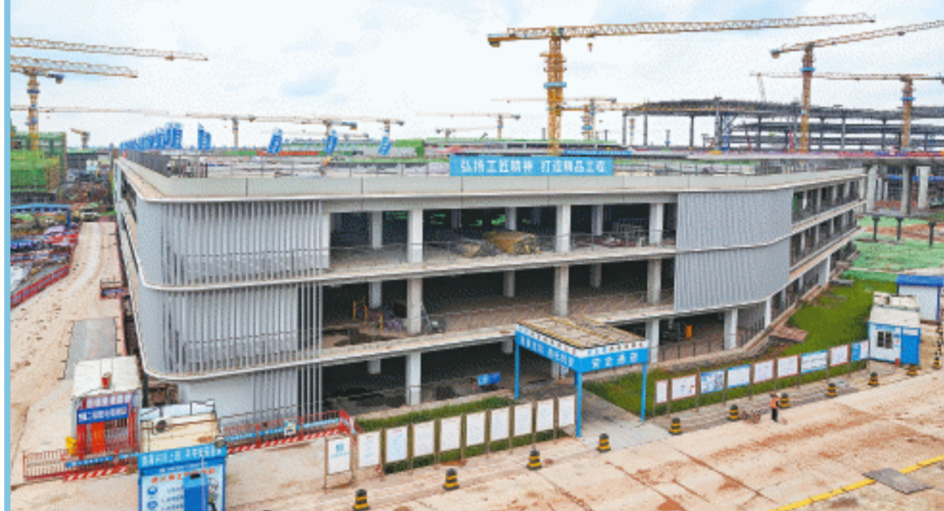
近日,长沙机场改扩建工程综合交通枢纽主体结构工程全面完工,正式进入装饰装修阶段。

长沙晚报4月24日讯(全媒体记者 陈登辉 通讯员 孙柏华 邹婷)随着最后一块小屋面完成,近日,长沙机场改扩建工程综合交通枢纽(简称GTC)主体结构工程全面完工,正式进入装饰装修阶段,全国最复杂的机场综合交通枢纽深基坑群拔地而起,“换乘之王”轮廓尽显。