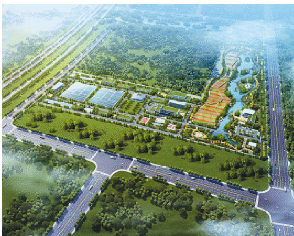
大王山水质净化厂(一期)项目规划效果图。图片由受访方提供

延伸阅读 大王山水质净化厂(一期)位于长潭西高速以东，东临规划白鹿路，西临规划支路，南临规划红桥大道，北侧为规划观音港水系。项目规划用地面积约264亩，纳污范围包括大王山旅游度假区和大王山南片区，建设内容包括污水处理厂厂区、进水提升泵站、人工湿地、湿地展览馆等。