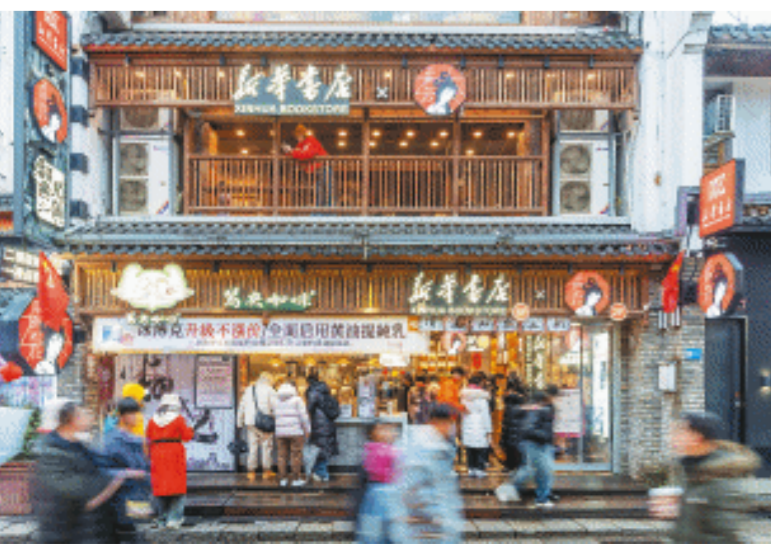
新华书店·茶颜悦色联名店位于长沙太平老街。