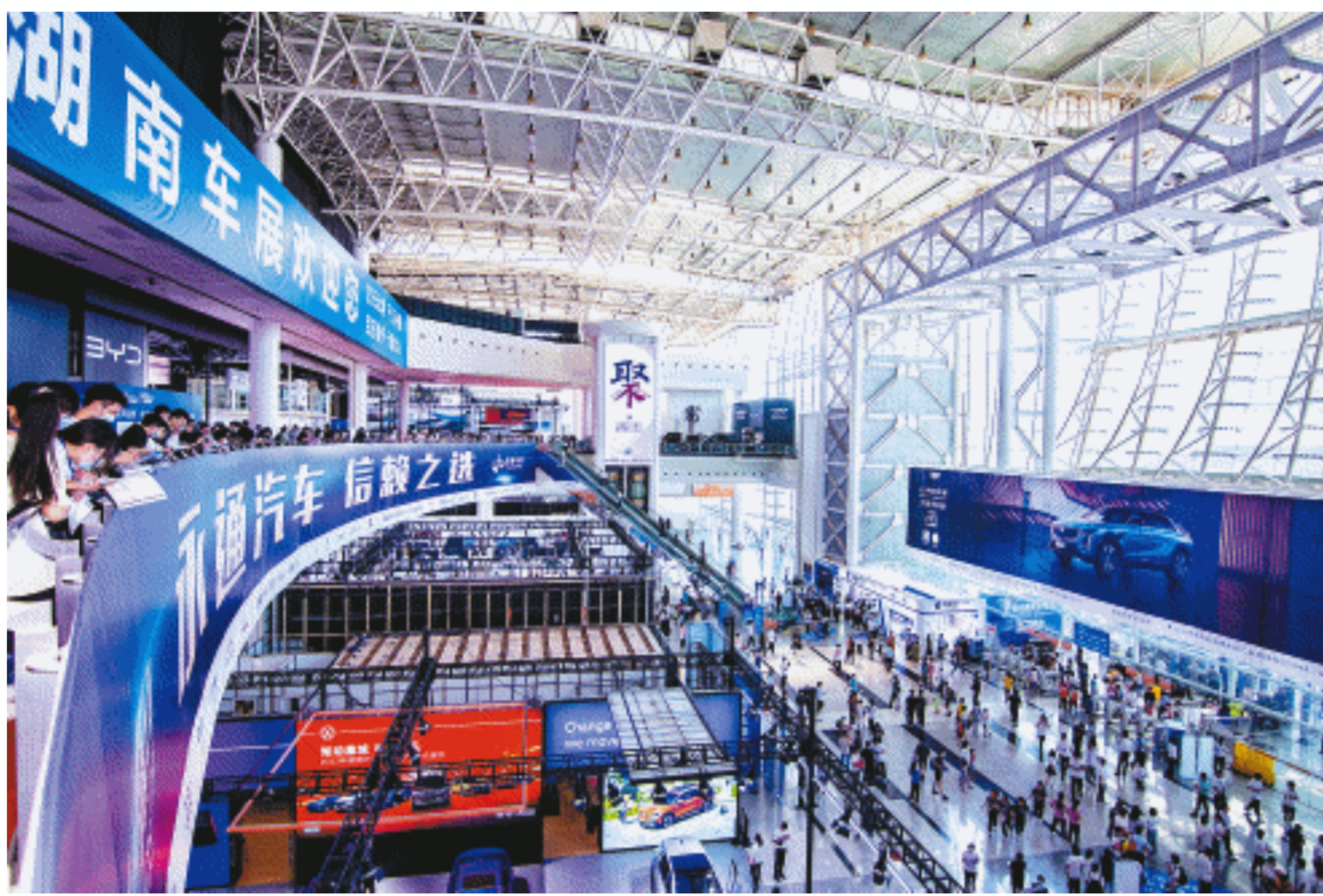
湖南车展已成为展示长沙汽车产业蓬勃发展的重要窗口。长沙晚报通讯员 吴振根 摄（资料图）

今年车展期间，组委会不仅推出了现场购车大奖、以旧换新大奖，还携手各大汽车品牌和异业跨界合作伙伴，策划安排了丰厚的逛展看车大奖。6天展期，入场观众凭有价门票（含电子票、纸质有价票、不含证件）均可参与“观展购车有好礼 百万大奖天天送”活动。每天11时和16时各抽奖一轮，每轮抽奖总金额390名，现场兑发奖品。