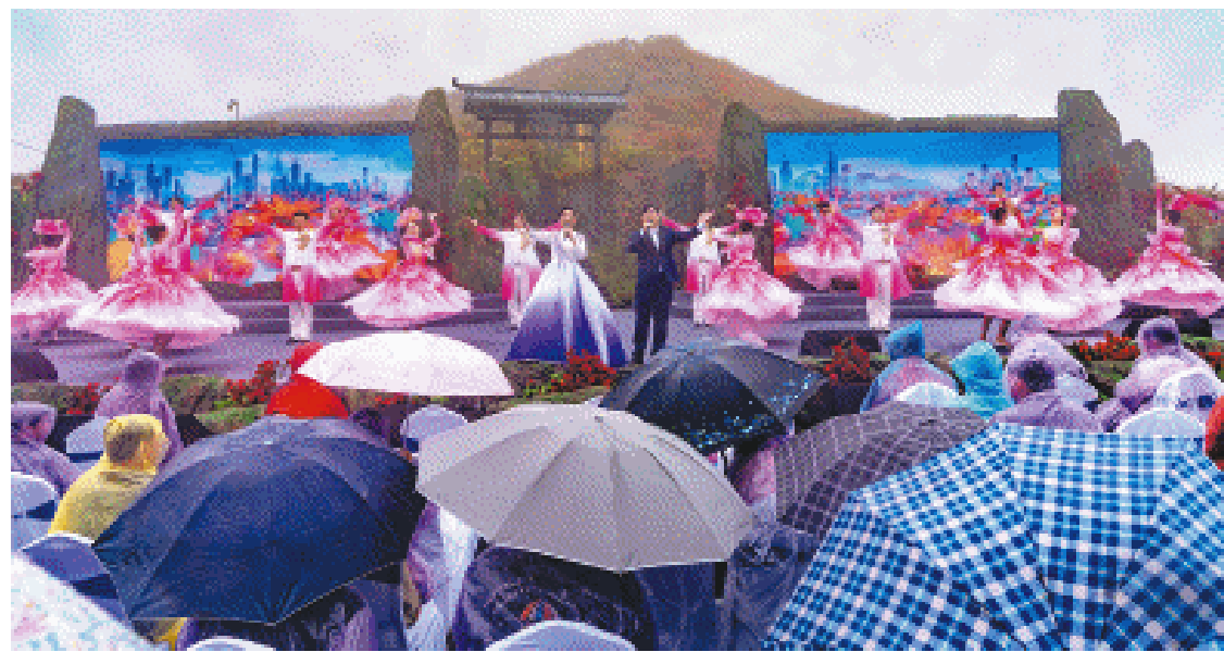
图为开幕式文艺表演现场。

在大围山之麓的杜鹃花海中,来自市属文艺院团的艺术家们带来一场精彩的文艺演出。由中国歌剧舞剧院青年歌