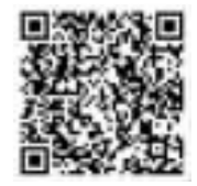
扫码看辣视频