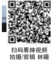
扫码看辣视频