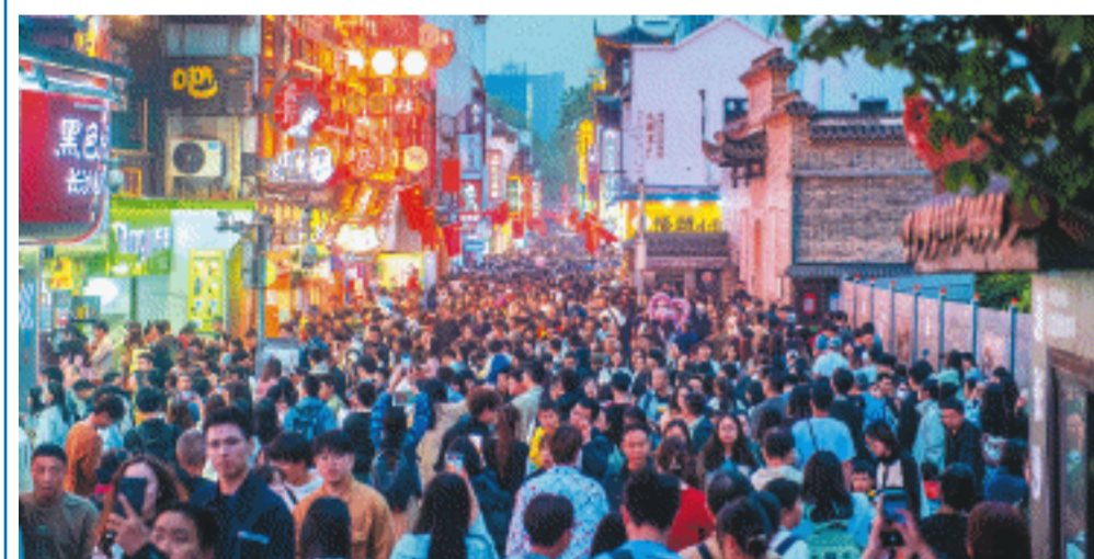
“五一”假期长沙共接待游客617.48万人次，其中省外游客51.95万人次。长沙晚报全媒体记者 邹麟 摄