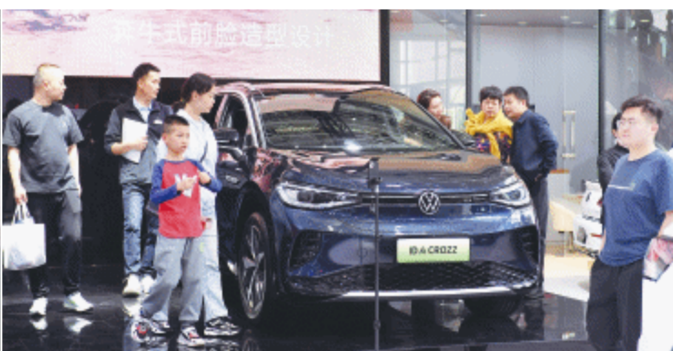
5月5日，2024湖南汽车展览会暨长沙市汽车消费节闭幕。

长沙晚报5月5日讯(全媒体记者 黄能)“五一”假期，人们旅游热情高涨。记者从长沙市文旅广电局获悉，根据大数据建模分析显示：2024年“五一”假期，长沙市共计接待游客617.48万人次，游客总花费达72.46亿元。其中，省外游客51.95万人次，占比8.41%；本省游客565.53万人次，占比91.59%。