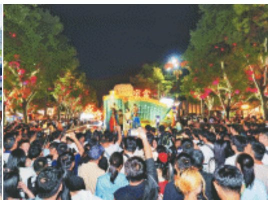
互动节目“盛唐密盒”人气火爆。