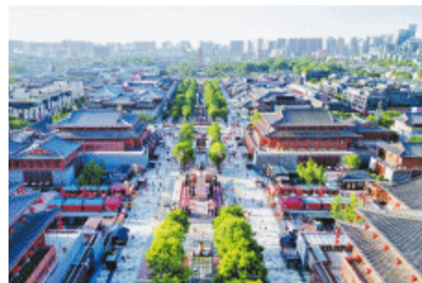
大唐不夜城街区总长约2公里，这是日景航拍。