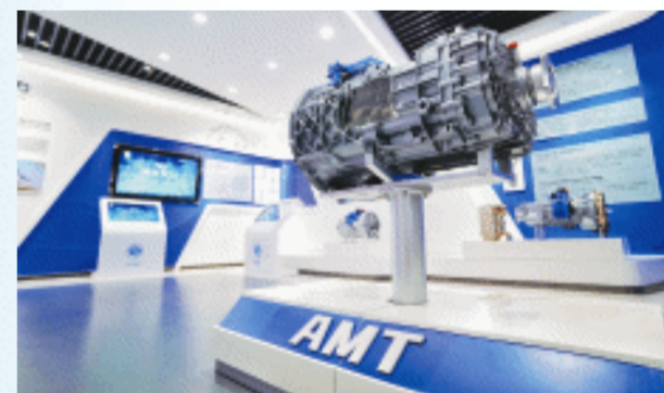
西安法士特汽车传动有限公司的变速器产品。

今年，西安继续深化“三项改革”试点牵引科技体制改革，优化产业投资基金功能，推动“科技—产业—金融”良性循环，打通束缚发展新质生产力的堵点卡点。在秦创原综合服务中心不远处，正在建设的两链融合创新创业孵化中心、两链融合双创促进中心两栋建筑拔地而起。