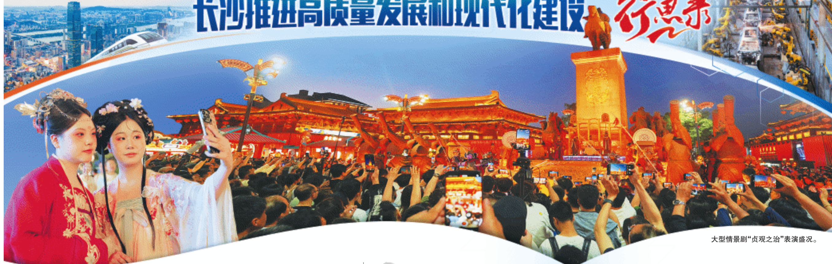
大型情景剧“贞观之治”表演盛况。