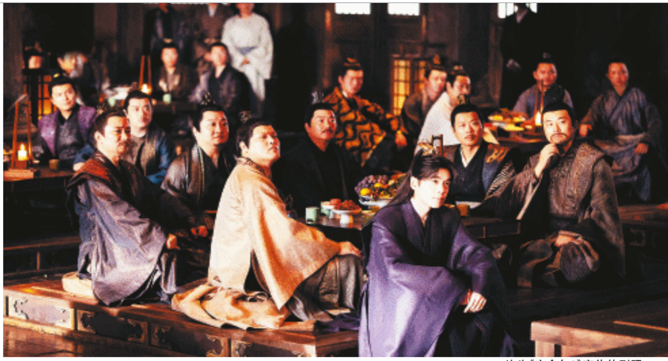
均为《庆余年2》宣传剧照照