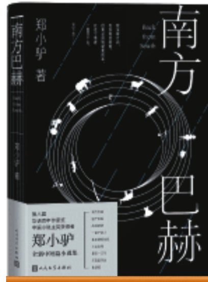
《南方巴赫》/郑小驴 著/ 人民文学出版社/2024年3月

湖南年轻作家郑小驴曾凭借小说集同名中篇小说《南方巴赫》斩获第八届华语青年作家奖中篇小说主奖。新出版的小说集《南方巴赫》收录了郑小驴近期新创作的《南方巴赫》《国产轮胎》《战地新娘》《一屋子敌人》《衡阳牌拖拉机》《火山边缘》等九篇中短篇小说，小说以寻找为主题，立足湖南的乡土与城市，精准地将作者对现实世界的观察转化为虚构故事，以剖析时代，照亮幽暗人性。叙事生猛，残酷中透着诗与善良，具有直击人心的力量。这是豆瓣网关于郑小驴这本小说集的介绍。我更愿从“事件视界”来解析郑小驴的这本小说集。