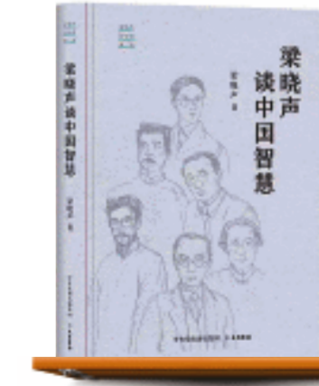
“梁晓声谈中国”系列：《梁晓声谈中国人》《梁晓声谈中国故事》《梁晓声谈中国智慧》/梁晓声 著/大有书局/2024年2月