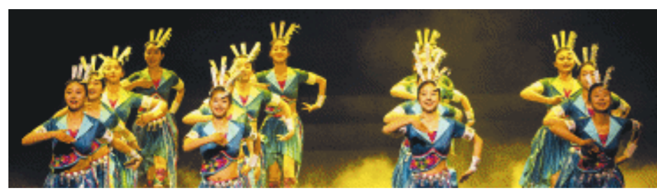
20日晚，“文化馆，人民的终身美育学校”——长沙市2024年文化馆服务宣传周系列活动启动式在长沙实验剧场举行。