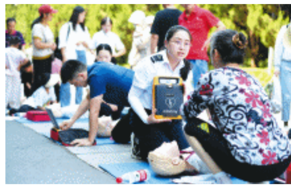
长沙市120急救中心专家向市民讲解急救知识与技能。

在公园散步就能学到急救知识 长沙市120急救中心专家现场演示培训 向市民普及急救知识与技能