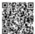
扫码看视频

当日清晨7时30分,义诊领号处就排起了长队,他们手捧《长沙晚报》,认真地选择即将开始义诊的专家。9时30分许,简短的健康生活节启动仪式结束后,15位名医专家开始为市民义诊。与此同时,中南大学湘雅二医院、浏阳市健康医院心内科分会也拉开帷幕,吸引了众多市民前来问诊。