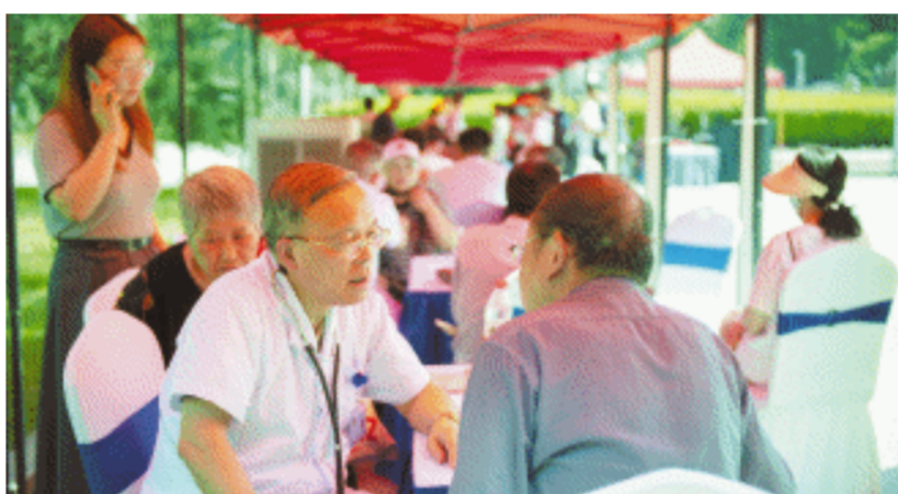
名医专家耐心地为市民义诊。

“我们既看了病,又学到了健康知识。”当天的专家义诊,市民满意而归,希望这样的专家义诊多举办几次,把健康生活节打造成一个惠及全体百姓、增加市民健康福祉的良好平台。