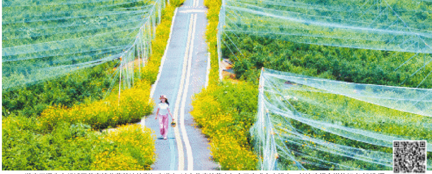
游客正漫步在望城区茶亭镇蓝莓基地的彩虹步道上，过去贫瘠的荒山如今已变成金山银山。

“北纬28度水果大世界”项目核心区位于长沙市望城区中山村境内的舒记果园，规划占地约1260亩，项目总投资约1.3亿元。该项目规划为“一心二带四区多组团”，即：世界亚热带水果展示核心片区；亚热带水果推广示范带和水果文化风情体验带；综合接待服务区、名优品种种植示范区、优良种苗繁育推广区、沉浸式互动体验区；由多个不同类型水果品种种植示范组团、多个特色水果文旅主题组团共同组成多样化的观光、体验和互动区域。