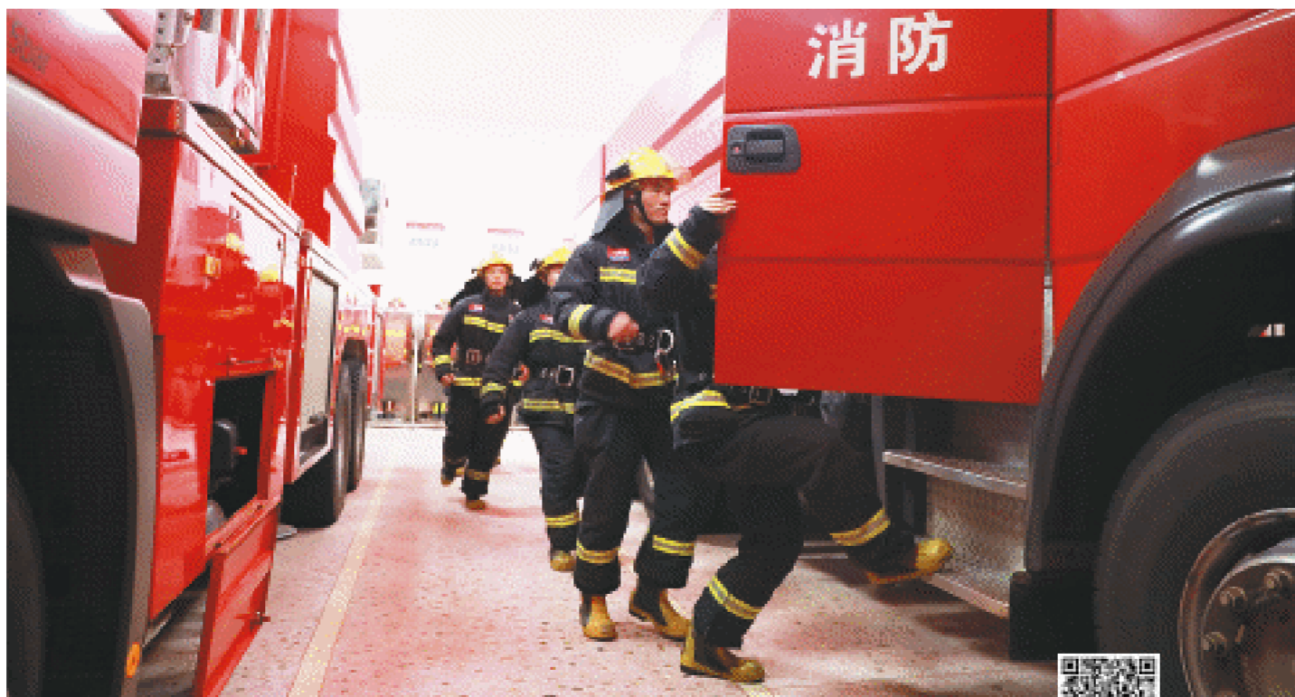
即便是在凌晨的熟睡状态，消防救援人员只要听到警铃响起，就会立马弹起，用最快速度出警。