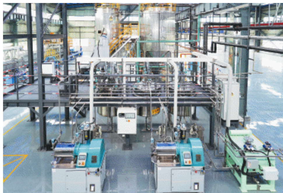
湖南智电谷新能源技术研究院虽然成立只有半年多时间,但已孵化企业3家。

“在新能源材料领域,从以克为单位的研发,再到以千克为单位的试验生产,直至以吨为单位的成熟产品,将来都可以在智电谷研究院内完成。”李新海介绍,另一生产基地已在望城经开区铜官工业园开始建设。