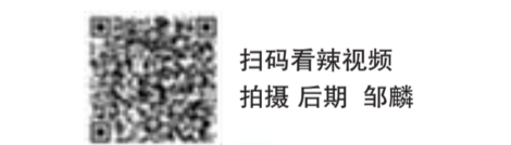
扫码看辣视频