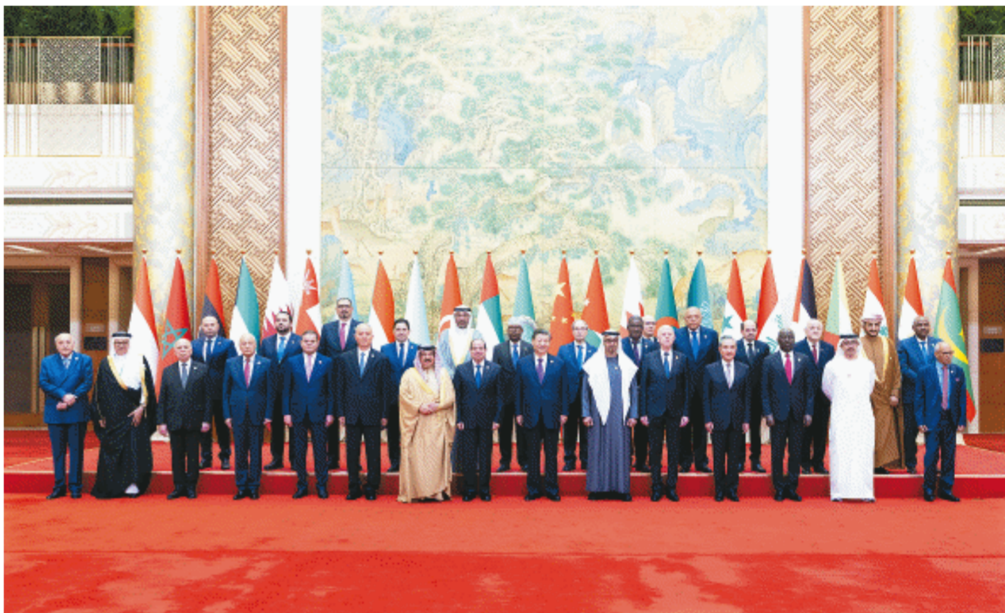
5月30日上午,国家主席习近平在北京钓鱼台国宾馆出席中阿合作论坛第十届部长级会议开幕式并发表主旨讲话。这是习近平同巴林国王哈马德、埃及总统塞西、突尼斯总统赛义德、阿联酋总统穆罕默德、阿盟秘书长盖特以及22位阿拉伯国家代表团团长集体合影。