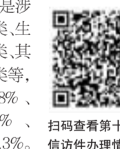
扫码查看第十二批信访件办理情况

交办213件)。其中,长沙累计收到举报件801(+4)件,含湖南湘江新区205.5件、雨花区120件、天心区94件、浏阳市73.5件、长沙县66件、开福区61件、宁乡市55.5件、芙蓉区53.5件、望城区37件、长沙经开区13件、市城管局12件、市工信局5件、市住建局4.5件、市轨道交通集团3.5件、长沙城发集团1件。 从生态环境问题类型来看,累计涉及大气类问题的举报最多,占27.8%;其次是涉水类、噪声类、生态类、土壤类、其他类、辐射类等,分别占22.8%、17.1%、14.3%、9.1%、7.6%、1.3%。