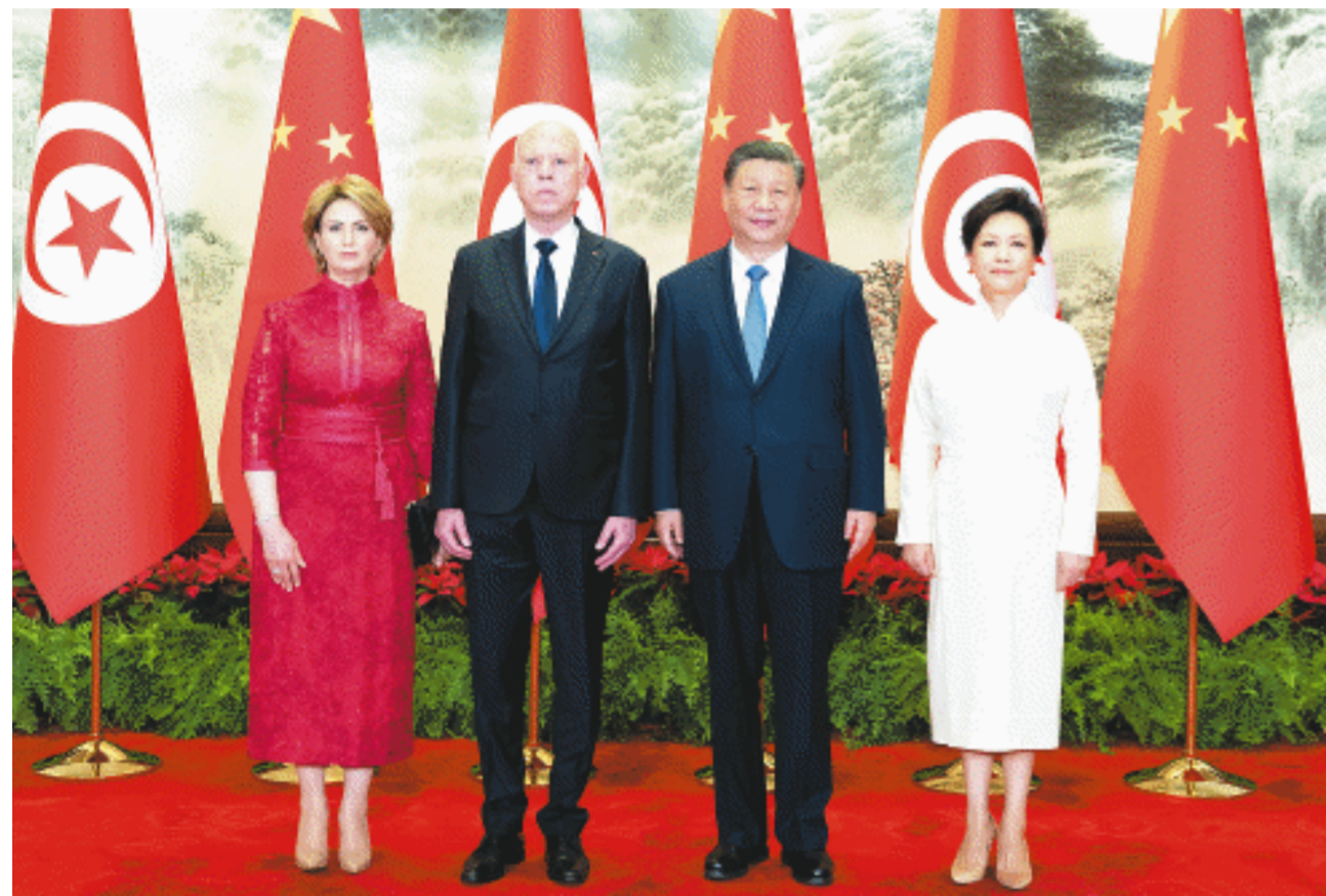
5月31日上午，国家主席习近平在北京人民大会堂同来华国事访问并出席中国—阿拉伯国家合作论坛第十届部长级会议开幕式的突尼斯总统赛义德举行会谈。这是会谈前，习近平和夫人彭丽媛同赛义德和夫人伊什拉芙合影。