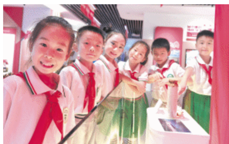
湘府英才益清小学的孩子收到一份特殊的儿童节礼物——南沙守礁官兵们寄来的沙子、贝壳、明信片。

“亲爱的解放军叔叔阿姨，我学习过一篇课文《富饶的西沙群岛》，我想南沙一定也很美丽，谢谢你们守卫祖国海疆，你们辛苦了。”前不久，湘府英才益清小学开展了以“长沙舰”为主题的少先队课，组织师生参观近现代海军装备主题展，