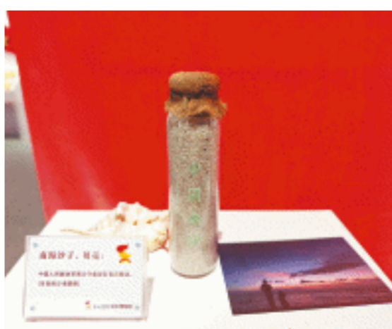
这些来自南沙的礼物收藏在天心区红领巾博物馆。