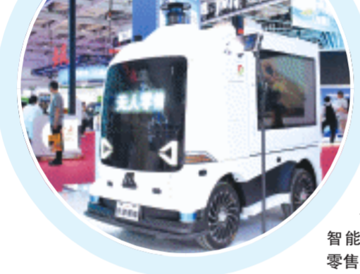
一行深智能的无人零售小车。