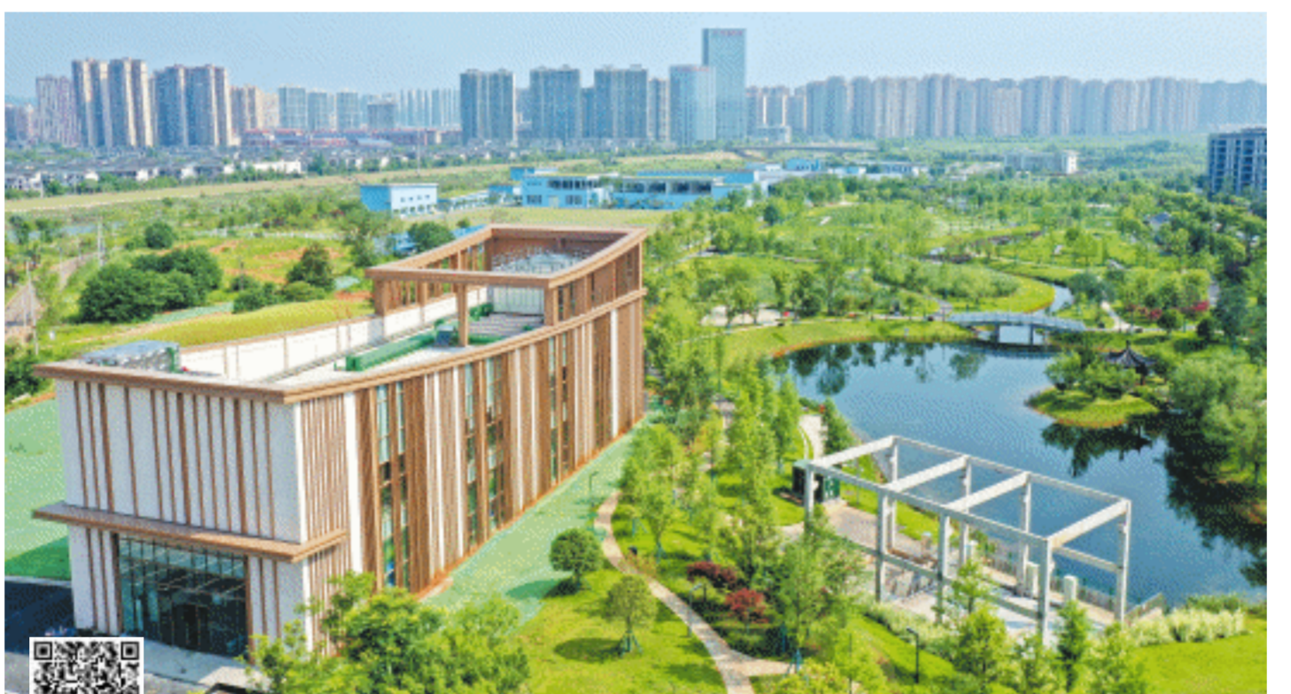
洋湖生态新城南区智慧能源站项目全面竣工。