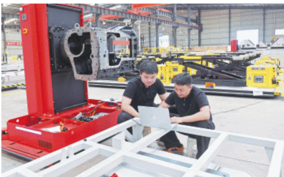
驰众机器人生产车间内,工作人员正在对AGV设备进行调试。