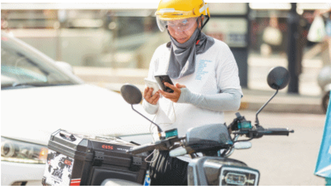
众多新业态形态劳动者活跃在长沙的大街小巷。

不难发现，新规一方面符合新业态形态的用工特点，不影响多劳多得；另一方面也着重在保障劳动者的休息权。