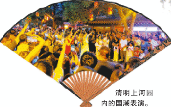
清明上河园内的国潮表演。