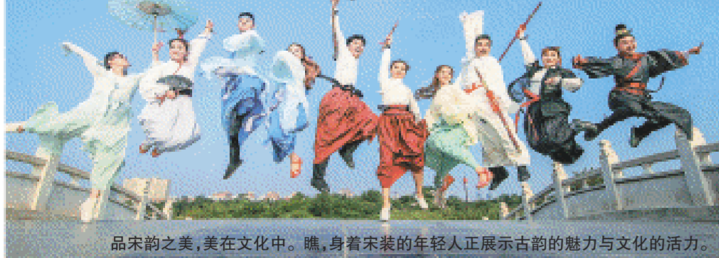
品宋韵之美，美在文化中。瞧，身着宋装的年轻人正展示古韵的魅力与文化的活力。

“守正创新，守的是文化之根，创的是旅游之新。文化是旅游的灵魂，旅游是文化的载体。开封之行，不虚此行。”现场观看演出的社长、总编无不伸出大拇指，点赞清明上河园利用科技赋能，打开“智慧文旅”新空间，开掘国风游乐、激发“沉浸旅游”新潜力，拓展夜游经济、丰富“消费场景”新体验等方面取得的新成果。