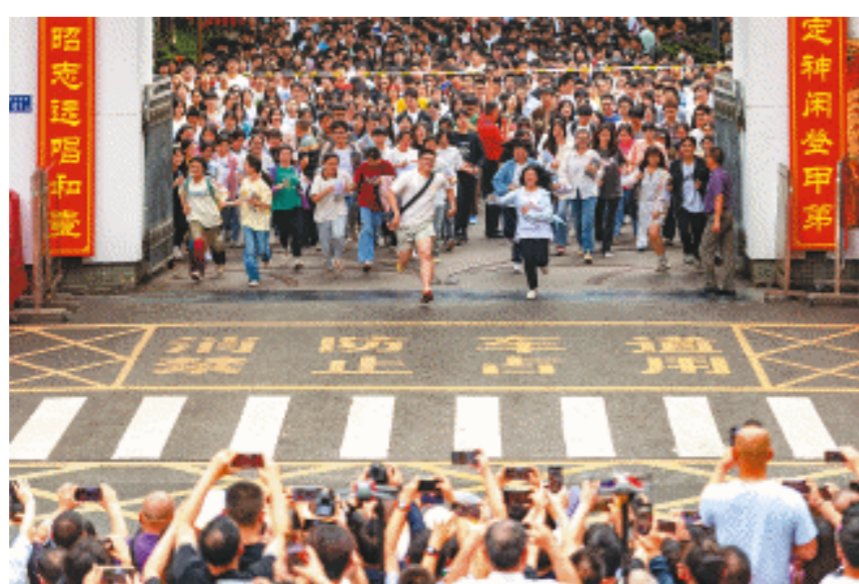
6月7日,在长沙市一中考点,完成下午数学考试的考生飞奔向考场,高考首日考试结束。

自高考筹备以来,全市各级各有关部门主动担当作为,认真履职尽责,做好高考各项准备工作。高考首日,全市考试组织严密、考务管理规范、考场秩序井然、考生服务周到、后勤保障有力。