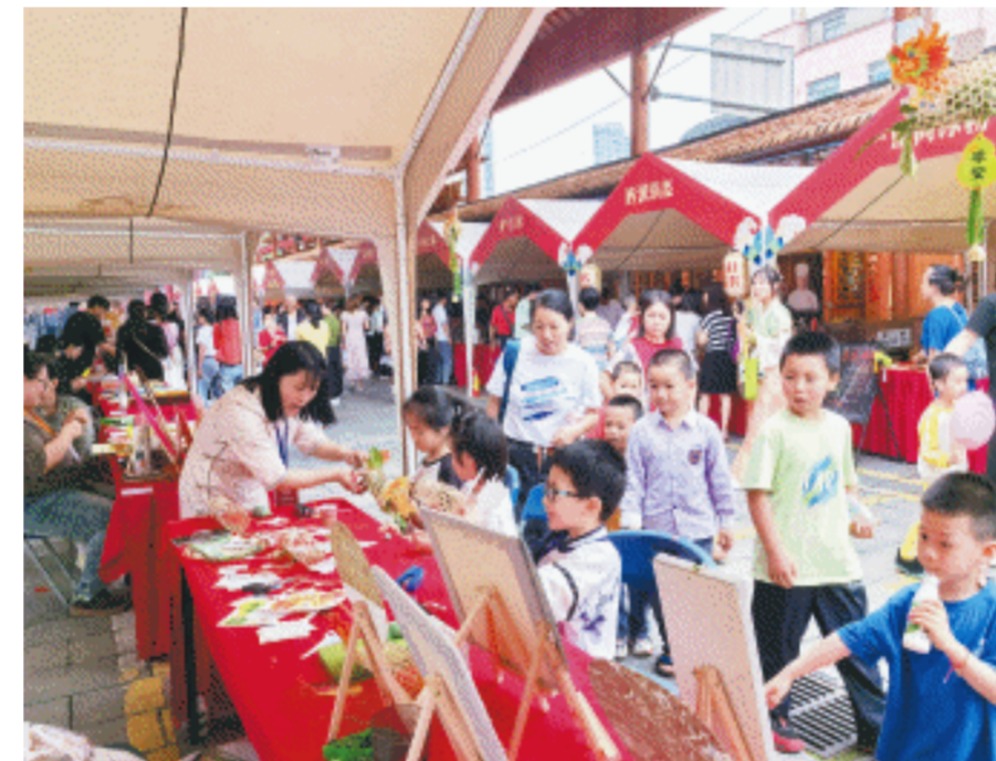
非遗集市上,非遗美食和技艺引发了孩子们的浓厚兴趣。