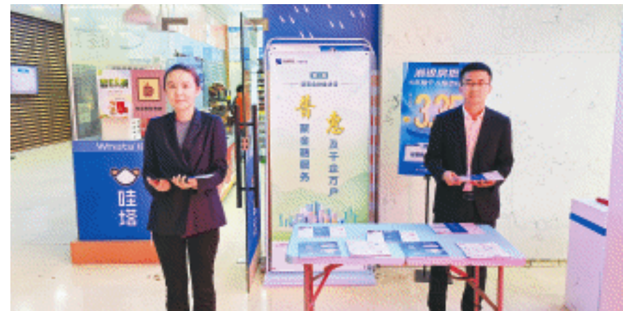
湖南银行长沙分行工作人员深入园区开展“普惠金融宣传月”活动。

科技金融、绿色金融、普惠金融, 三大领域的发展为经济社会发展赋予了新的动力和更多可能性。湖南银行长沙分行始终将“国之大事”化为“行之要务”, 锚定金融强国建设目标, 坚定不移走好中国特色金融发展之路。下一阶段, 该行将继续当好服务实体经济的主力军和维护金融稳定的压舱石, 携手各界, 共同迈向更加智慧、可持续和高质量发展的金融未来。