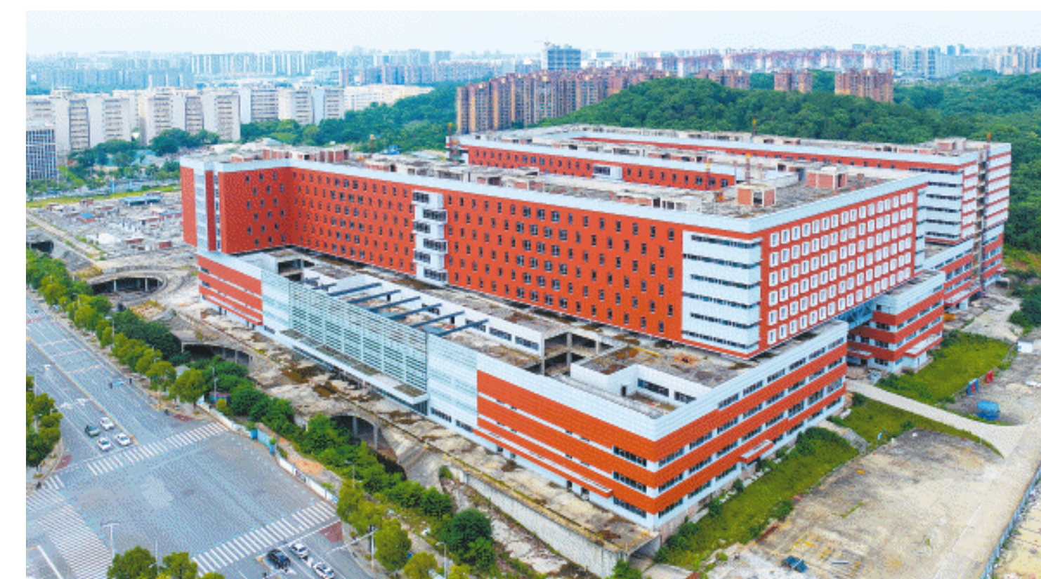
位于长株潭都市圈中部的中南大学湘雅医院新院区,A栋大楼已完成外立面幕墙施工,露出亮眼的红白色外墙。

14日下午,记者在新谷路与果子园路交叉路口看到,蓝天白云下,一栋红白外墙的建筑分外耀眼,这就是中南大学湘雅医院新院区A栋。一位市民告诉记者,这里与长沙市