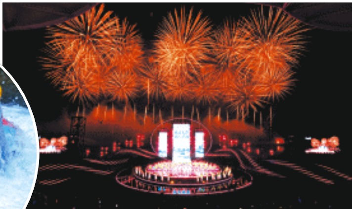
2023年10月13日，第二届长沙市旅游发展大会在浏阳开幕。