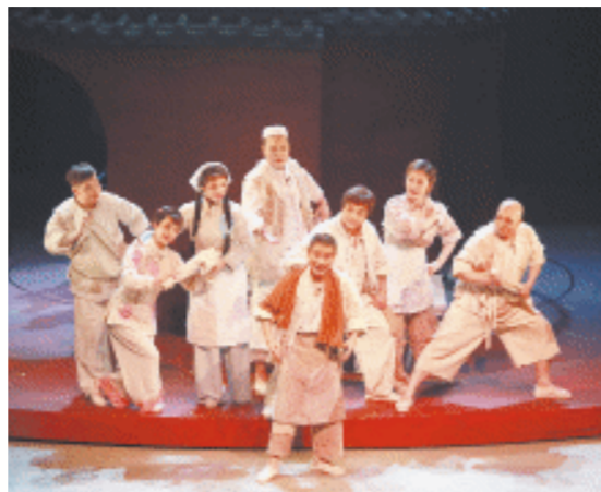
《火宫殿》讲述了卖臭豆腐的姜三爹将臭豆腐带进火宫殿的故事。

据了解，《火宫殿》由业内顶尖专家团队倾情打造，著名剧作家吴傲君、王密根共同创作，著名导演韩剑英执导，著名作曲家陈耀、国家二级演奏员陈珊珊担任作曲，优秀青年作曲家周阳亮担任配器，优秀青年新锐设计师张滴洋担任舞美设计，著名灯光设计师刘传龙担任灯光指导，著名服装设计师秦文宝担任服装指导，著名造型设计师江霞担任造型设计，全国戏曲表演领军人才、衡阳花鼓戏传承人、国家二级演员朱贵兵领衔主演。