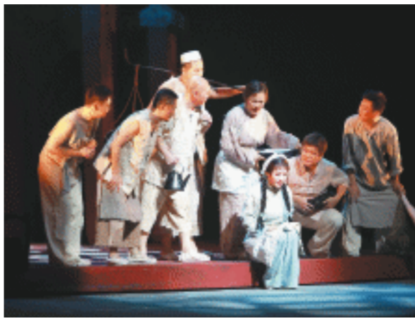
《火宫殿》以20世纪40年代末的长沙为背景。