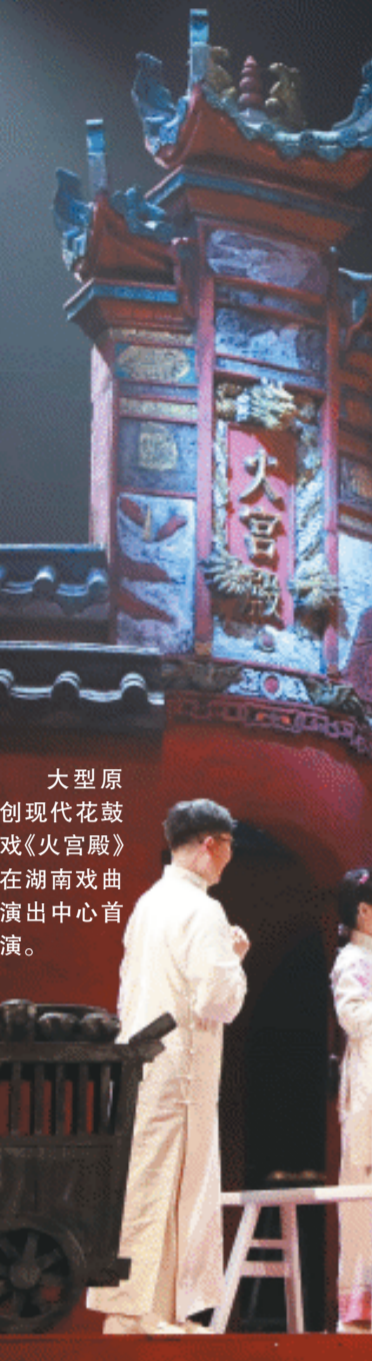
大型原创现代花鼓戏《火宫殿》在湖南戏曲演出中心首演。

长沙晚报6月25日讯（全媒体记者 宁莎鸥 实习生 李若兮）“臭豆腐，闻起来臭，吃起来香，若是蘸点辣椒酱，味道真是非寻常……”“快点炸呀。”25日晚，省花鼓戏保护传承中心大型原创现代花鼓戏《火宫殿》在湖南戏曲演出中心首演。湘味十足的舞台、充满烟火气的剧情赢得了观众广泛好评。27日，该剧还将在湖南戏曲演出中心公演，有兴趣的观众可到场观演。