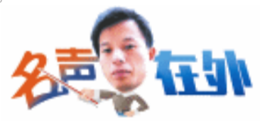
责编/杨云龙 美编/何朝霞 校对/肖应林

“魔笛”还想继续这支国家队扛在肩头，那就让我们祝愿他和他的球队在2026年的美加墨世界杯上，再次书写传奇吧。