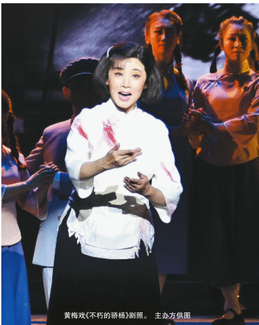
黄梅戏《不朽的杨开慧》剧照。

除安徽艺术家献演的这两场剧目之外，湖南省花鼓戏保护传承中心将于7月30日、31日在安徽大剧院分别演出花鼓戏《桃花烟雨》与《连升三级》。