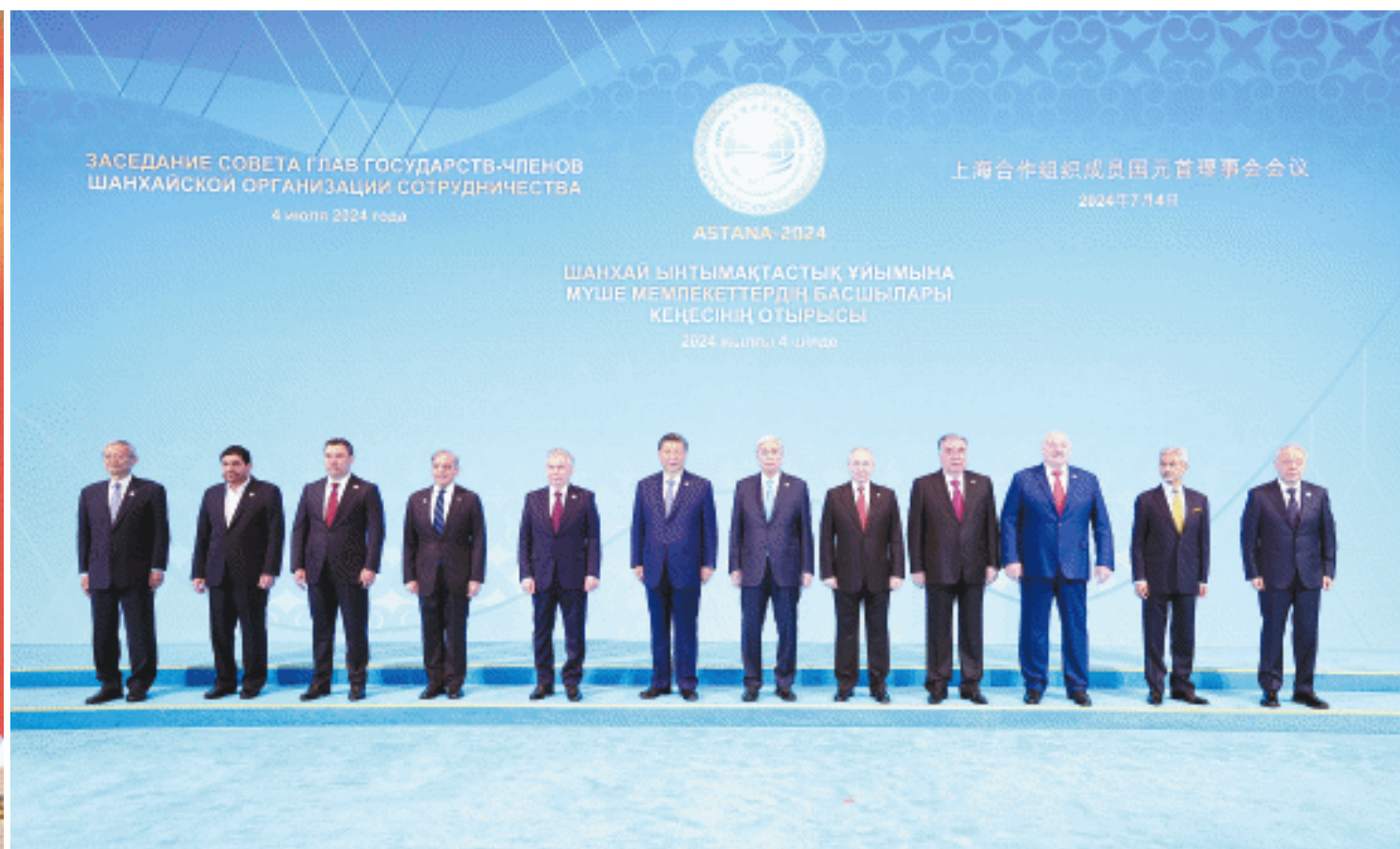
当地时间7月4日上午,国家主席习近平在阿斯塔纳独立宫出席上海合作组织成员国元首理事会第二十四次会议。这是习近平同上海合作组织成员国领导人集体合影。